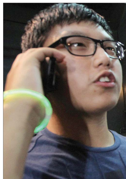
La classe du collège Pablo-Neruda mer